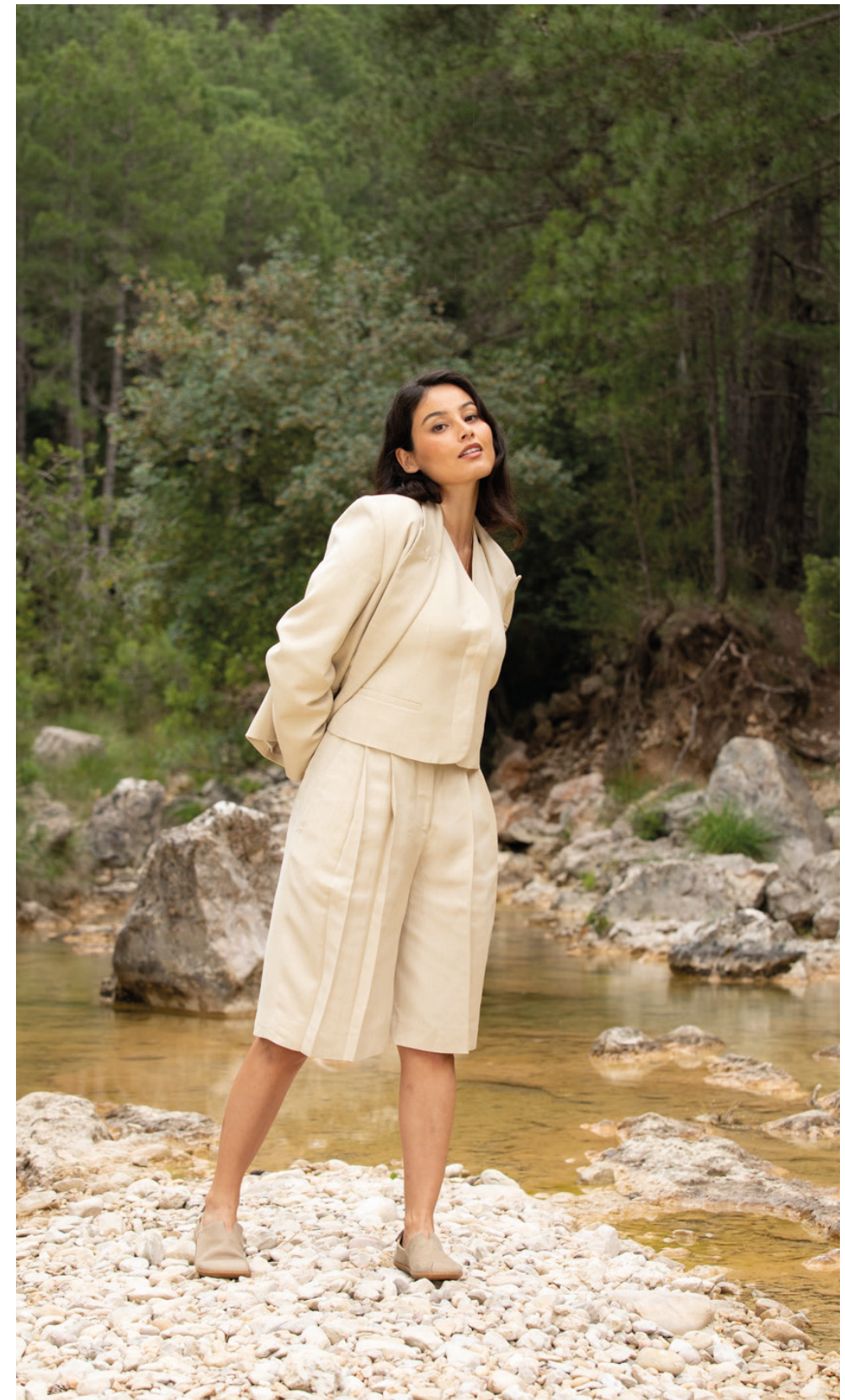
EL VIAJERO UNISEX COLLECTION SS24