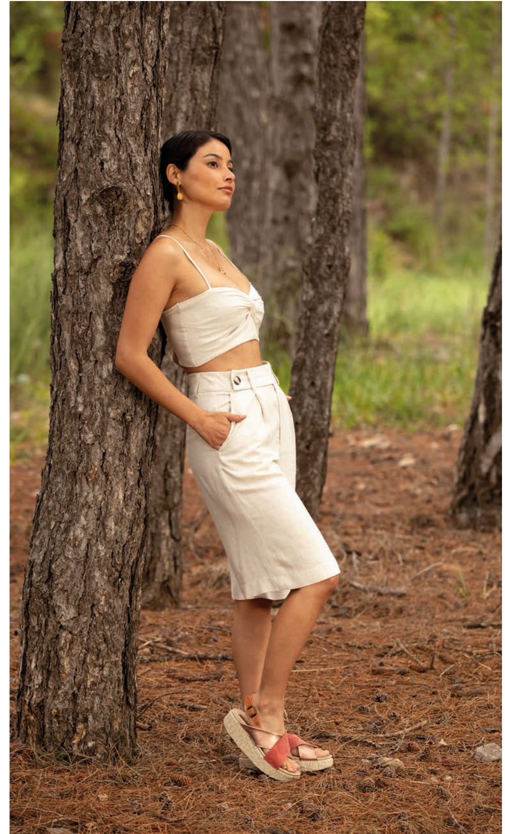
SHINRIN WOMEN COLLECTION SS24